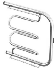
Рис.1 Твист (боковое подключение)

Структура условного обозначения с указанием размеров: