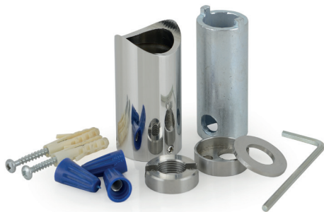
Модуль скрытого подключения для МЭМ «Сунержа» арт. 00-1522-0000

Используя модуль скрытого подключения возможна установка электрического дизайн радиатора от компании «Сунержа» в нужном для вас месте без видимых проводов.